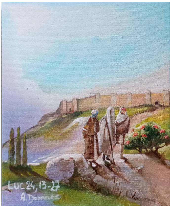
Pèlerins d'Emmaüs (trois) Luc 24, 13-27